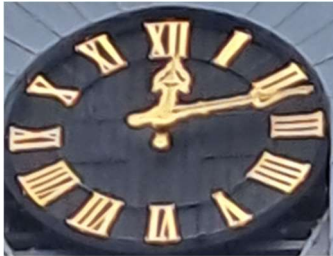
Huidige tijd 12 minuten over 12 Antwoord = 17 min. over 12