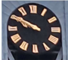
Huidige tijd 10 minuten voor 10 Antwoord = 5 min. over 10