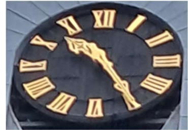
Huidige tijd 5 minuten voor half 11 Antwoord = 11 uur

Schrijf de digitale tijd onder deze klokken.