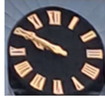
10 minuten voor 10 uur